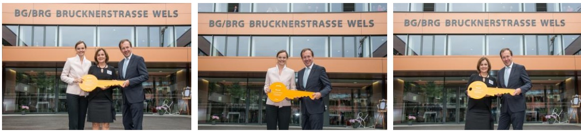
Foto-Download BG BRG Wels Eröffnung/Schlüsselübergabe: